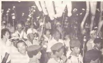
E parada di flambeuw na caminda pa stadion acompaña pa e drumband di padvinder.